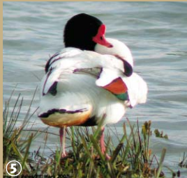
Tadorne de Belon.

Tadorne de Belon, ce « canard-lapin » qui habite dans des terriers ; le Guépier d'Europe inconnu il y a quelques années, devient un habitué du secteur, la dune fossile étant l'un de ses terrains de chasse favoris.