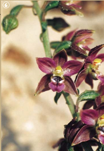
Haléboraine des Pays Bas.

La préciosité est souvent fragile. En l'absence de gestion, le boisement prend le dessus sur les systèmes herbacés. Pour préserver les milieux ras favorables à la flore, aux insectes et à certaines espèces d'oiseaux comme les traquets mottés, les alouettes lulu et les tariers pâtres, la dune accueille des chevaux rustiques de race Haflinger. S'invitent également en ce lieu magique, le Héron cendré et le